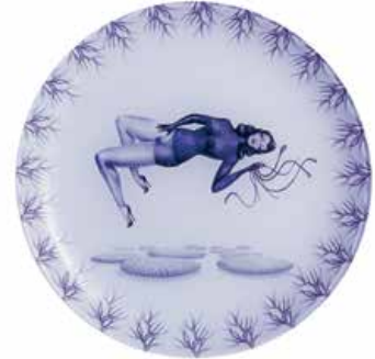
2 — Mirka Lugosi , assiettes / plates édition limitée, coffret de 4 / limited edition, box of 4, ed. Luminarc & Palais de Tokyo, 2012, €39,00 - €44,00 www.luminarc.com www.palaisdetokyo.com