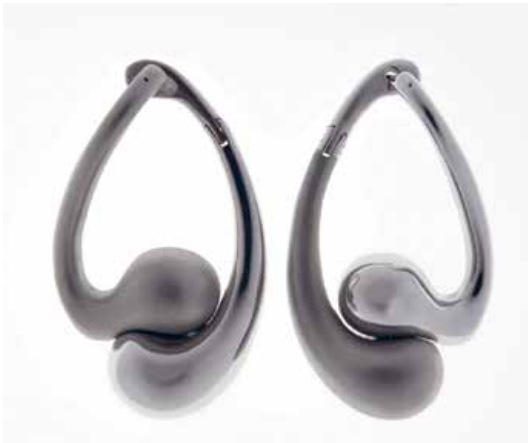
21 — Lee Ufan , boucles d'oreilles, argent poli et brossé / sterling silver earrings, ed. 8 + 4 EA/AP, 2012-2013. Courtesy Galerie Minimasterpiece, Prix sur demande / Price on request www.galerieminimasterpiece.com