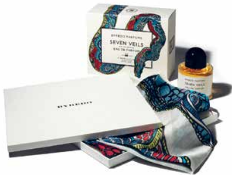
5 — Seven Veils , eau de parfum et écharpe en soie, inspirés de la légende biblique de la danse de Salomé, édition limitée / perfume and silk scarf, inspired by the biblical tale of Salome's dance, limited edition, Byredo, 2012, €290,00 www.byredo.com